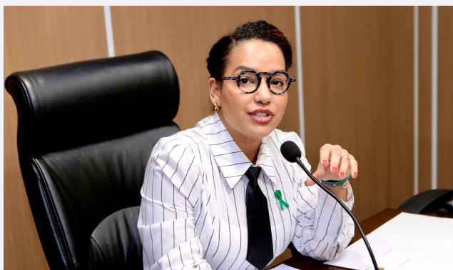
DEPUTADA LÍVIA DUARTE (PSOL)

Do ponto de vista econômico, sabemos que gerará oportunidades de emprego e renda para a população. As obras estruturantes serão um ganho excepcional para a população de Belém e do Pará. Acredito que as forças políticas, independente de divergências políticas, convergem nesse momento para que esses avanços sejam concretizados. Então, creio que os governo federal, estadual e municipal irão conseguir realizar o que se espera para que a COP aconteça.