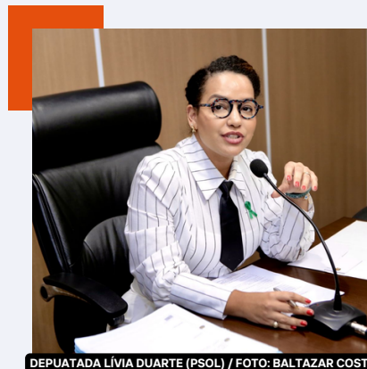
DEPUTADA LÍVIA DUARTE (PSOL)

Lívia Duarte (PSOL) em 2023, foi uma das três autoridades políticas da Alepa (Assembleia Legislativa do Pará) melhor avaliada pelo público em votação popular . A parlamentar concedeu entrevista ao jornalista político Taciano Cassimiro, e falou sobre a COP-30 em Belém, cenário eleitoral em Belém com destaque para Edmilson Rodrigues, governo Lula e Helder Barbalho , a mulher na política entre outros. Lívia também destacou sua posição sobre a exploração de petróleo na foz do rio Amazonas . Setores da imprensa em 2023 levantaram questionamentos sobre a posição política da deputada Lívia Duarte na Alepa , oposição ou situação? Ela responde na entrevista.