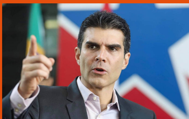
GOVERNADOR HELDER BARBALHO)

– Esse resultado me deixa feliz, me trouxe a confirmação de que estamos no caminho certo: com presença nas comunidades, apoio às causas populares, gabinete de portas abertas, proposições cotidianas que vão ao encontro dos anseios coletivos e sem medo de avançar em pautas inovadoras e desafiadoras, como a licença menstrual, a dignidade menstrual, o combate ao racismo e à violência contra mulheres, negros e negras, indígenas, ribeirinhos e LGBTQIAP+. Por isso, tenho gratidão por aqueles e aquelas que votaram em mim nesse prêmio. O trabalho foi intenso no primeiro ano de mandato e temos energia para seguir nesse ritmo pelos próximos anos