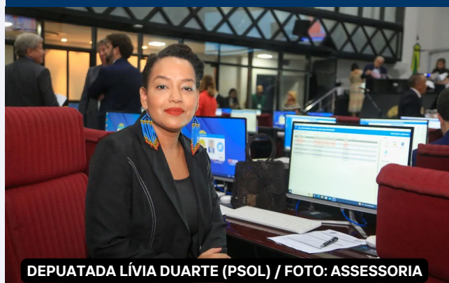
DEPUTADA LÍVIA DUARTE (PSOL)

APOSTAMOS NA VIRADA DE CHAVE, NA BREVE SUPERACÃO DE VÁRIOS IMPASSÉS, MESMO SABENDO QUE, PARA QUEM TORCE PELO PIOR, NENHUMA AÇÃO DA PREFEITURA SERÁ SUFICIENTE.