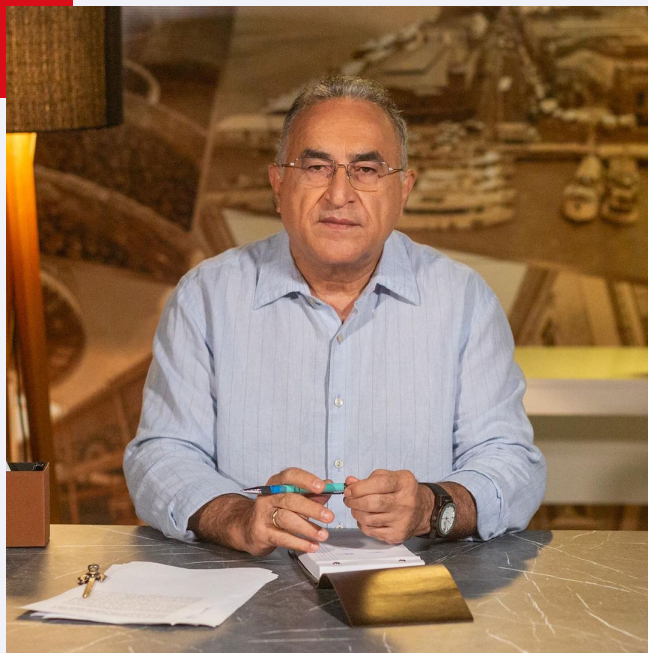
PREFEITO DE BELÉM EDMILSON RODRIGUES (PSOL): INSTAGRAM

Em segundo lugar, o prefeito Edmilson está tomando as providências para resolver os problemas e, neste ano de 2024, várias iniciativas que demandaram tempo para serem construídas, entram no desfecho decisivo, como a licitação do lixo; a restauração de prédios históricos como o Palácio Antônio Lemos, Palacete Pinho e Solar Flávio Nassar; o aumento da frota de ônibus; as obras do Programa de Macrodrenagem da Bacia da Estrada Nova (Promaben) no combate aos alagamentos; a reforma do Ver-o-Peso anunciada para março e outros.